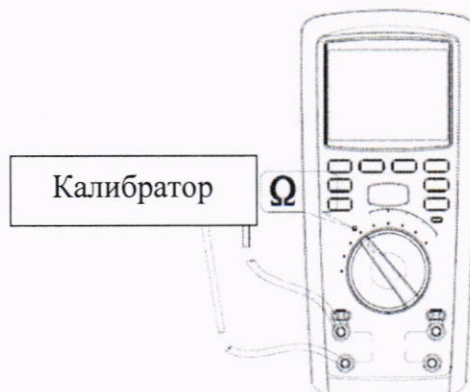
Рисунок 5 – Схема подключений для определения абсолютной основной погрешности измерений электрического сопротивления постоянному току для мегаомметров модификации RGK RT-30