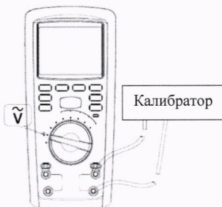
Рисунок 3 – Схема подключений для определения абсолютной основной погрешности измерений напряжения переменного тока

1) Подключить к измерительным входам мегаомметра калибратор в соответствии с рисунком 3.