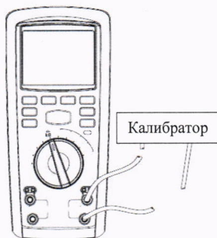
Рисунок 7 – Схема подключений для определения абсолютной основной погрешности измерений электрического сопротивления постоянному току (свыше 100 Ом), абсолютной основной погрешности измерений электрической емкости для мегаомметров модификации RGK RT-32