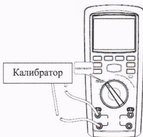
Рисунок 6 – Схема подключений для определения абсолютной основной погрешности измерений электрического сопротивления постоянному току для мегаомметров модификации RGK RT-32 (для значений электрического сопротивления постоянному току от 0,01 до 100 Ом)