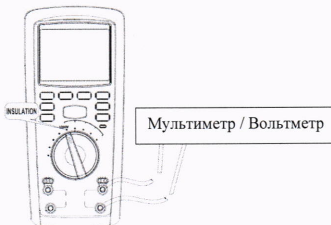
Рисунок 1 – Схема подключений для проверки диапазона установки испытательного напряжения постоянного тока