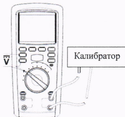
Рисунок 4 – Схема подключений для определения абсолютной основной погрешности измерений напряжения постоянного тока